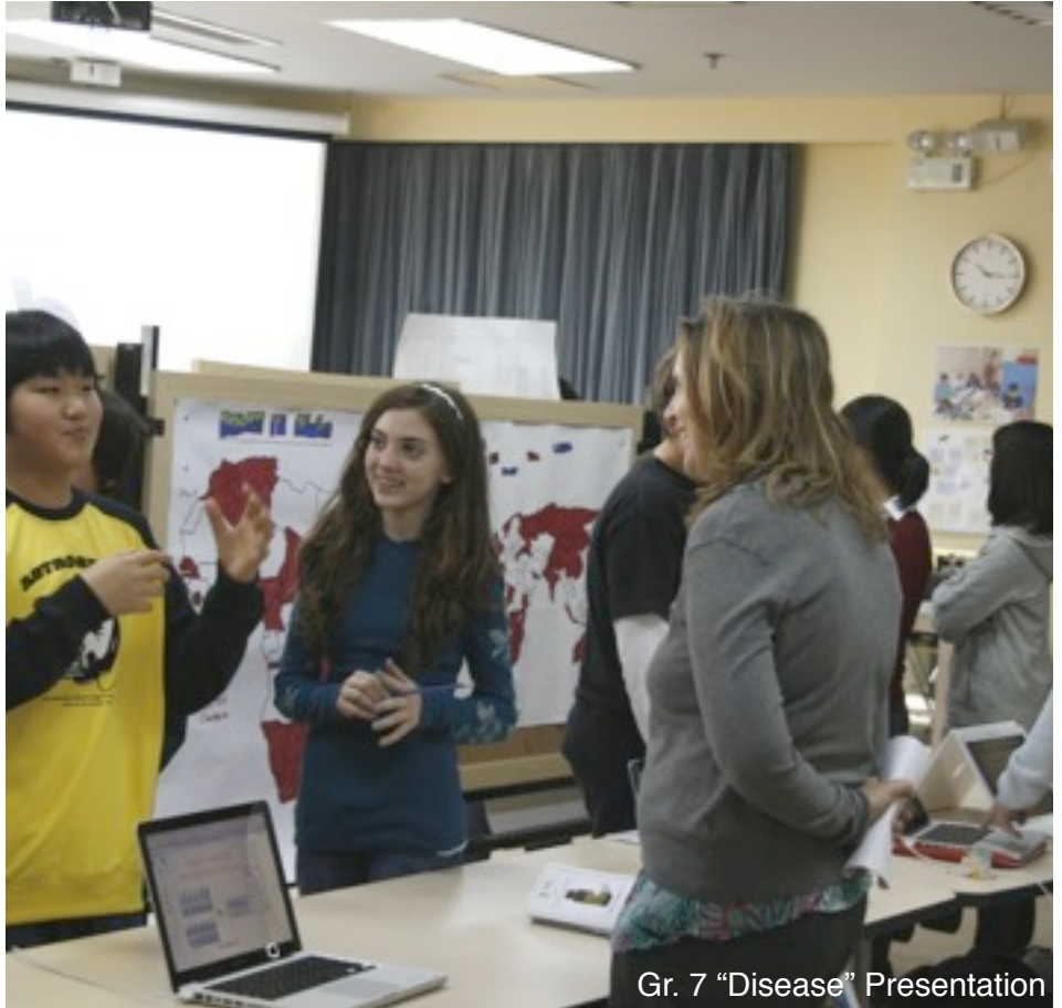
Gr. 7 "Disease" Presentation